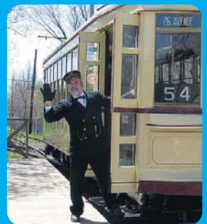
Pour en savoir plus : www.amistramwaysmontreal.org